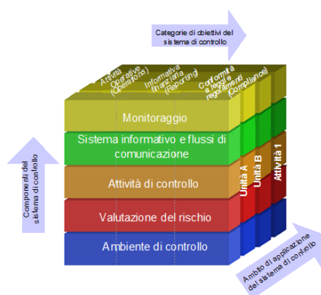
COSO Report (Edizione 2013)